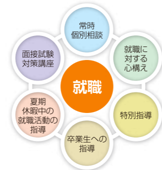
様々な角度から就職をバックアップ

幼稚園教諭・保育士のダブルライセンスと きめ細やかなバックアップ体制で就職も安心。